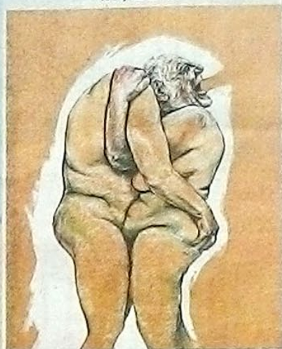
Wenn Deiss im Urlaub ein Rentnerpaar beim Eincremen beobachtet, kommt so etwas raus