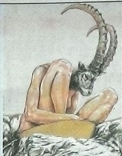
„Dieses Bild beschreibt den Sonntagmorgen, Kater, man weiß nicht wo man ist“, so Deiss